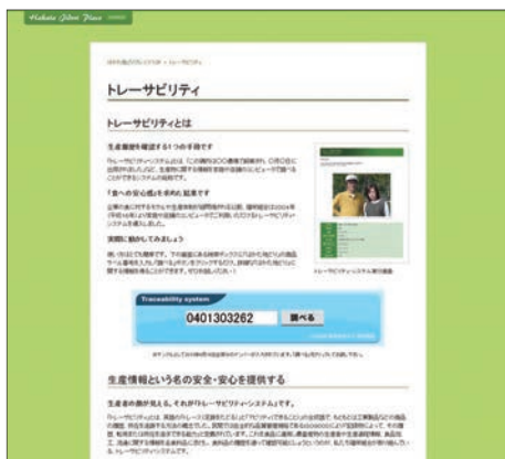
■システム開始画面(PCサイト)