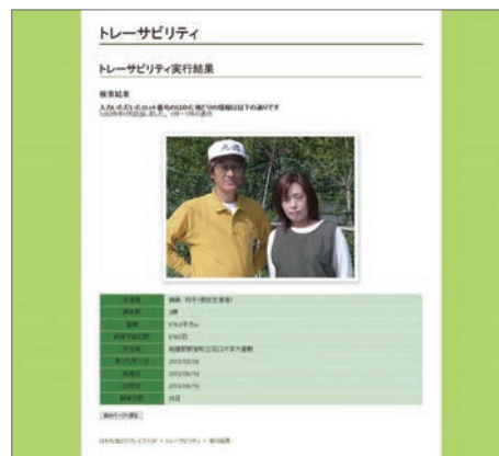
■システム実行画面(PCサイト)